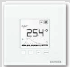
Die Bedien- und Informationsfläche als weiße Glasfront.