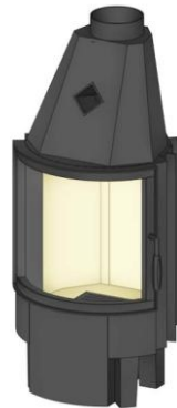
Türhöhe 510 mm