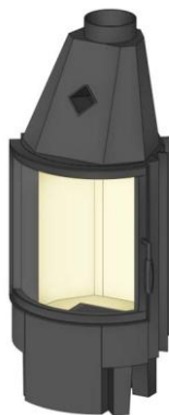
Türhöhe 570 mm