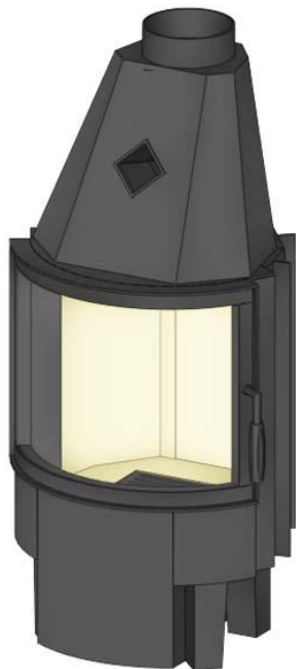
Türhöhe 450 mm